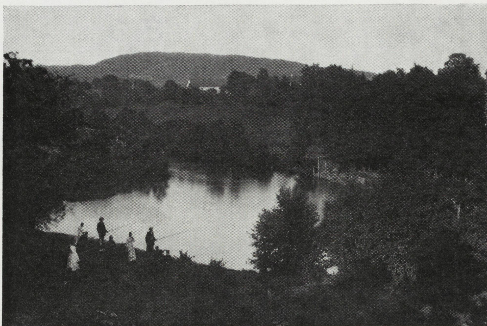
Fiske i Akerselven ved eiendommens 80 meter lange strandlinje. Det murede uthus på Sandaker i bakgrunnen. Det later til å herske en stille søndagsfred.

ikke ha vært så liketil, for han hadde sin arbeidsplass nede i Dronningensgate 11 hos Ludvigsen og Schjelderup, hvor han var kasserer.